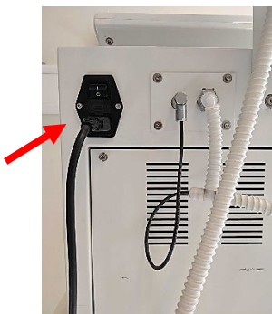
Interrupteur à l'arrière de l'appareil