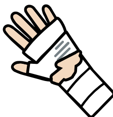
Compressé ou cassé

Si vous présentez un de ces signes ou si vous suspectez une éventuelle complication, contactez sans attendre un médecin ou un service spécialisé pour un conseil avisé.