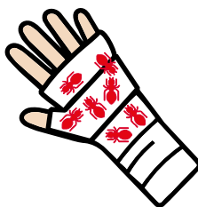
Fourmillements Diminution de la sensibilité