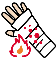
Augmentation de la chaleur