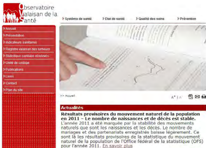
Fig. 1: Page d'accueil de l'OVS ( www.ovs.ch )

L'OVS a ainsi développé des indicateurs sanitaires d'intérêt pour tous les acteurs de la santé et la population en Valais et qui sont disponibles sur son site internet www.ovs.ch . Sur la page d'accueil du site de l'OVS (Figure 1) se trouve la rubrique « Indicateurs sanitaires » où les indicateurs ont été regroupés par thématique (démographie, assurance maladie, coûts de la santé, professions de la santé, prise en charge hospitalière, prise en charge médico-social, état de santé de la population). Les données détaillées relatives à ces indicateurs sont téléchargeables.