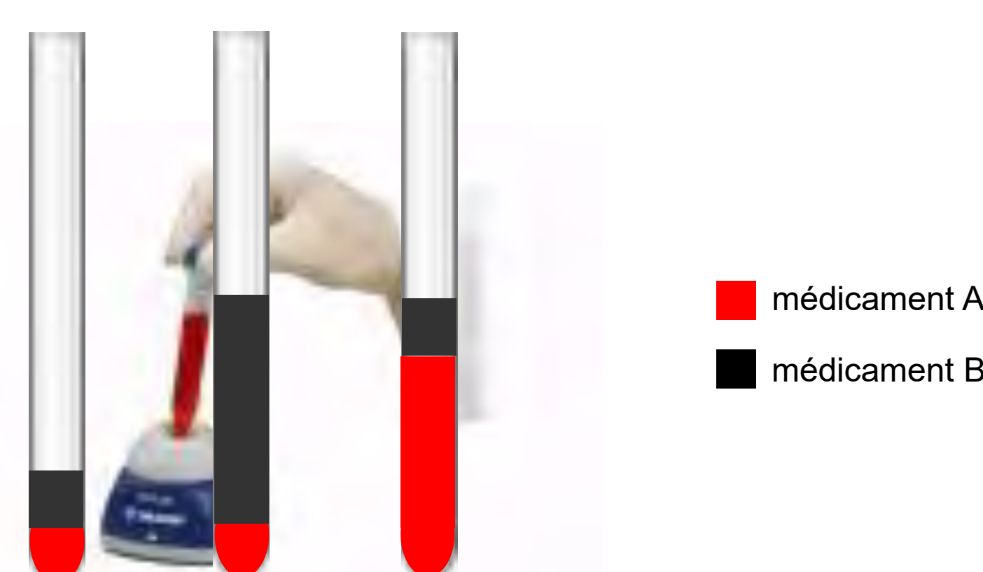
Fig. 1 – tests de compatibilités entre médicaments, 3 mélanges réalisés pour chaque duo de médicaments : - 1:1 - 1:4 - 4:1