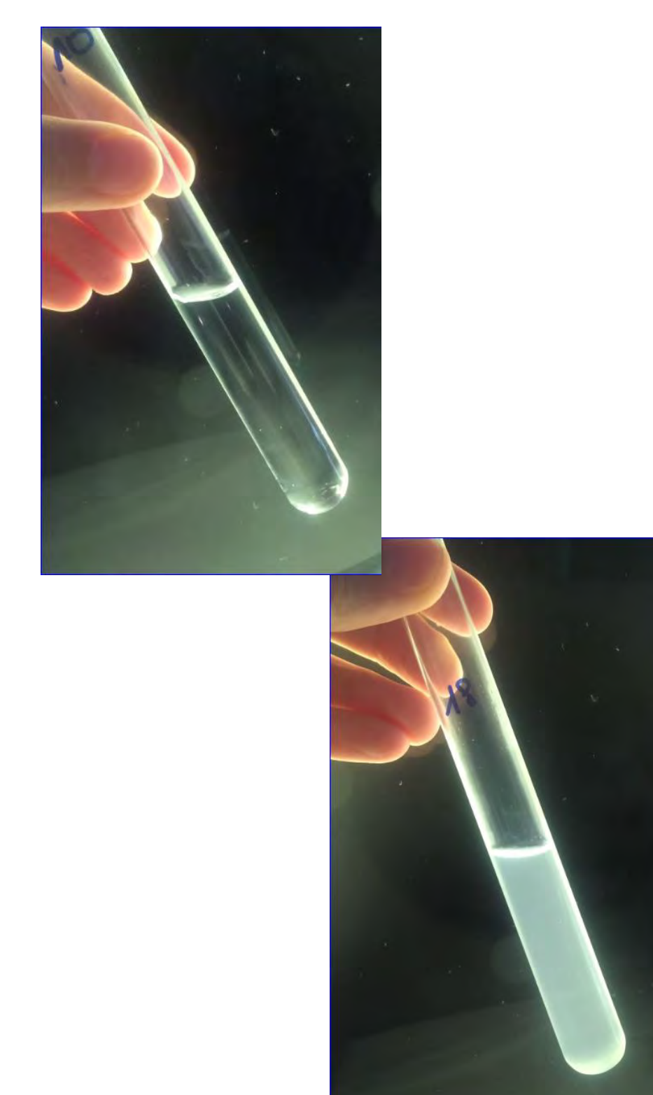
Fig. 3 – mélange visuellement compatible (en haut) et incompatible (en bas)